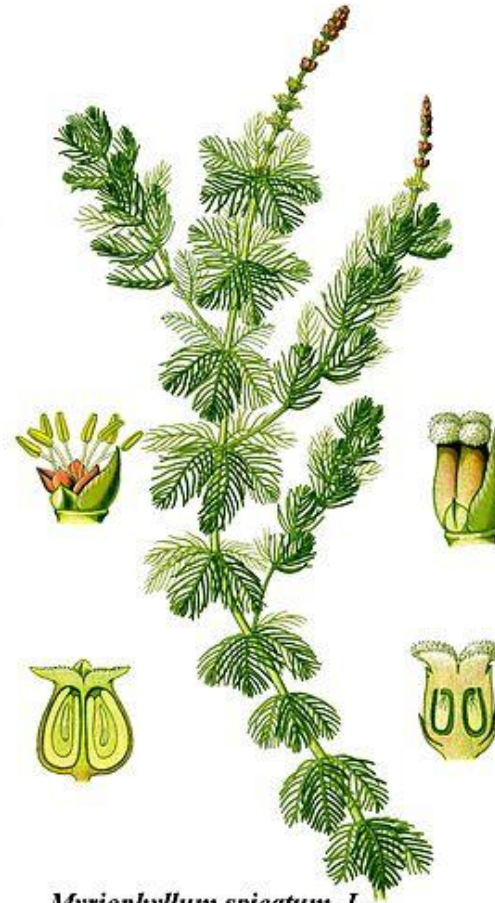
Myriophyllum spicatum L.

Feuilles: Les feuilles submergées sont verticillées (3 à 6 feuilles) et subdivisées en 12 à 24 paires de folioles.